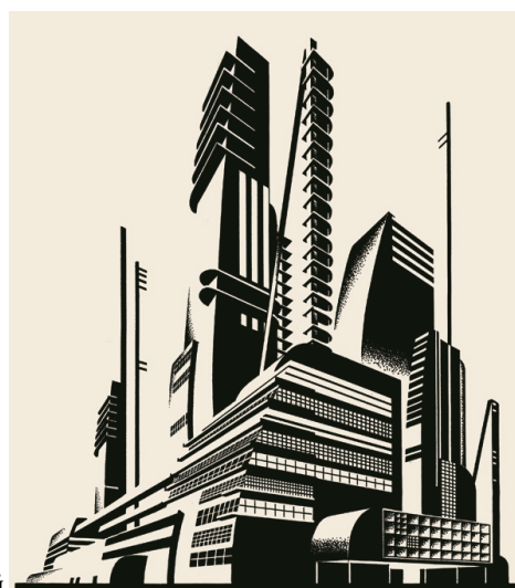
Пример итоговых композиций